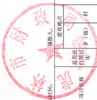
财政衔接推进乡村振兴资金项目（巩固拓展脱贫攻坚成果和乡村振兴任务）备案表（省级）